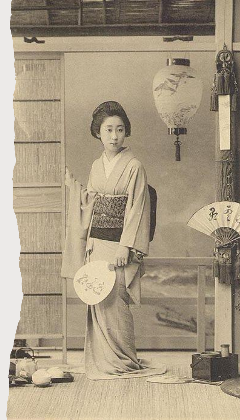
Tamagiku, of Shinbashi.